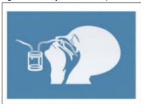
Figura 9: Ilustração da técnica para a coleta de aspirado nasofaríngeo.

Utilizar a técnica de aspirado de nasofaringe quando a unidade de saúde dispuser de frasco coletor de secreção, pois a amostra obtida por essa técnica pode concentrar maior número de células.